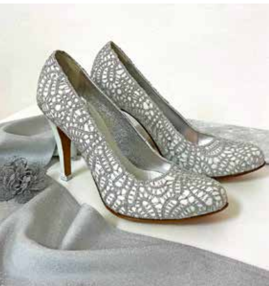
Čevlji s čipko na osrednji razstavi v galeriji Svoboda