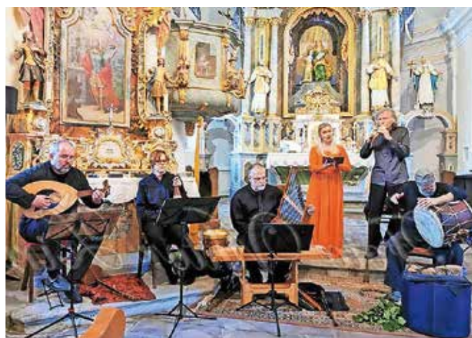
Koncert skupine Canso – mednarodnega ansambla za staro glasbo

Mednarodna zasedba prekaljenih glasbenikov je z glasbeno zbirko Cantigas de Santa Maria iz 13. stoletja, ki jo je dal zapisati kastiljski kralj Alfonso X., sledila povezovanju raznovrstnih kultur takratnega sveta v miroljubno in ustvarjalno sobivanje treh religij: krščanstva, islama in judovstva. Vse to se izraža v glasbi, kjer se mešajo evropski in arabski vplivi, posvetna glasba z liturgično, ljudska s prefinjeno glasbo provansalskih trubadurjev. V tem prostoru in času deluje presenetljivo sodobno, umerjeno po merah in razpoloženjih zdajšnjega poslušalca, ki se ji z lahkoto pusti zapeljati in navdušiti. Zgovorno dejstvo, da se je publika glasbenikom zahvalila s stoječim aplavzom, potrjuje zapisane besede. Dokaz več, kako glasba ne pozna meja, časovnih okvirjev, ki jih ime