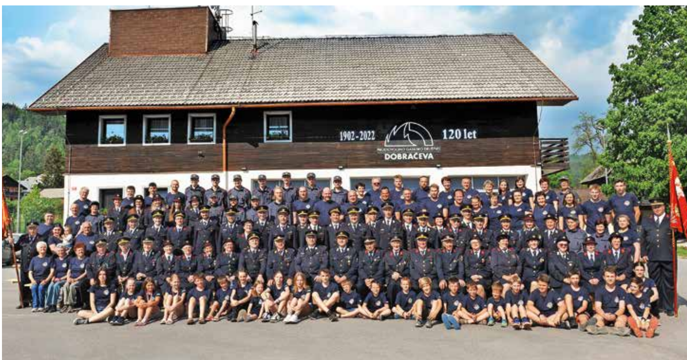
PGD Dobračeva praznuje 120-letnico delovanja.

S pomočjo denarnih sredstev Občine Žiri in Uprave za zaščito in reševanje RS ter lastnih in sponzorskih sredstev smo v zadnjih desetih letih nabavili za več kot 150.000 evrov različnega gasilskega orodja in druge gasilsko-reševalne opreme ter zaščitnih sredstev. Poleg tega smo organizirali ali se udeležili več kot štiristo operativnih gasilsko-reševalnih vaj večjega in manjšega obsega. Tu velja omeniti večkratno izvedbo Tehnično-reševalnega dneva PGD Dobračeva, skupnih vaj gasilskih enot šir-