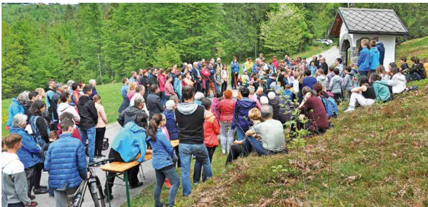
Šmarnice pri kapelici patra Pija v Žirovskem Vrhu

sijona. O vseh dogodkih boste obveščeni v nedeljskih oznanilih, v Glasu svetega Martina ali pa na FB-strani Župnije Žiri. Vse ljudi dobre volje vabimo, da se nam konec oktobra pridružijo in poglobijo svojo vero ter skupaj z nami širijo novico, da nismo sami, ampak je z nami Bog, ki ima za vsakega izmed nas poseben načrt.