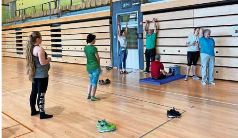
Meritve so letos prvič potekale v novi športni dvorani.

Sredi maja je v novi športni dvorani potekal ŽIRfit 2022, letos ponovno kot enodnevni športni dogodek, na katerem so udeleženci s pomočjo strokovnjakov in diagnostične baterije testov za ocenjevanje telesnega fitnesa dobili vpogled v svojo telesno zmogljivost in z njo povezane dejavnike tveganja za njihovo zdravje. Za informativno testiranje se je tokrat odločilo 90 posameznikov, najstarejši udeleženec je bil star 84, najmlajši pa 21 let, večinoma Žirovci, nekaj udeležencev pa je želja v skrbi za boljše zdravje pripeljala tudi od drugod. Letošnji ŽIRfit je udeležencem postregel tudi z nekaj novostmi. Meritve so prvič potekale v novi športni dvorani, test