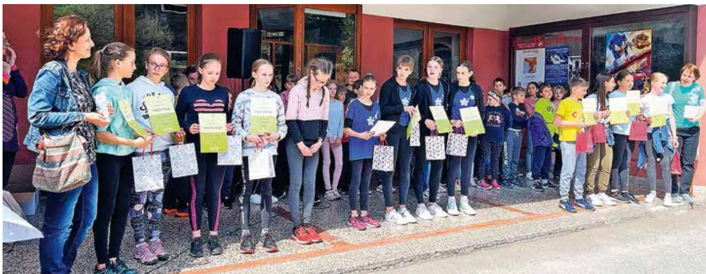
Na tekmovanju za otroke je zmagala ekipa iz klekljarske šole v Žireh (na sredini v modrih majicah s čipko).

Konec aprila in v začetku maja so potekali 16. Klekljarski dnevi. Osrednjo razstavo z naslovom Poklon ženski duši in izdelke z letošnjega natečaja z naslovom Riba si je še vedno mogoče ogledati v galeriji Svoboda.