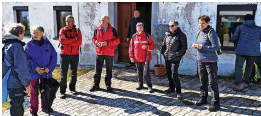
S prvega letošnjega romanja društva ŠmaR