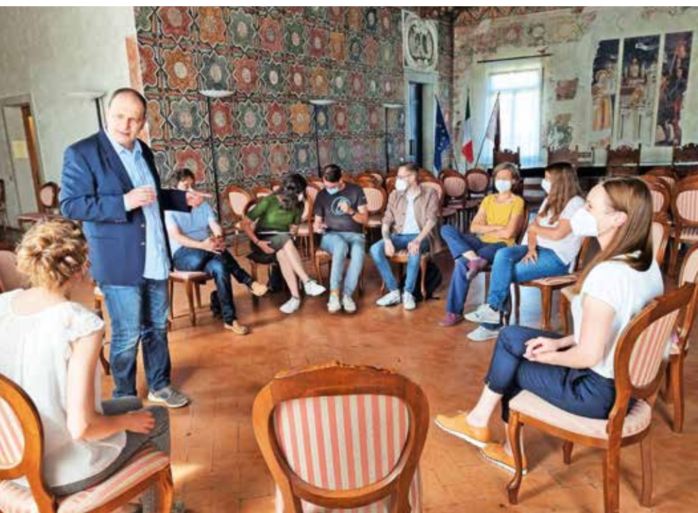
Utrinek z zaključnega srečanja projekta TAAFE v Trevisu.

Po slovesu in zahvalah za dobro sodelovanje smo se udeleženci zaključnega srečanja odpravili na pot proti domačim krajem. Marsikaj, kar smo slišali in videli, nam bo v prihodnosti prišlo prav. Občina Žiri je vendar starosti prijazna občina!