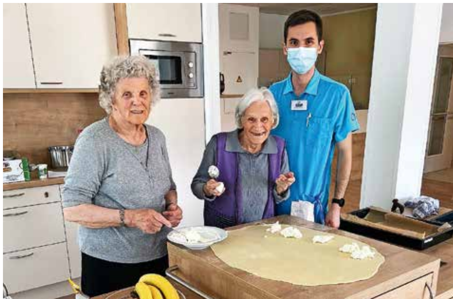
Stanovalki doma pri peki jabolčnega zavitka