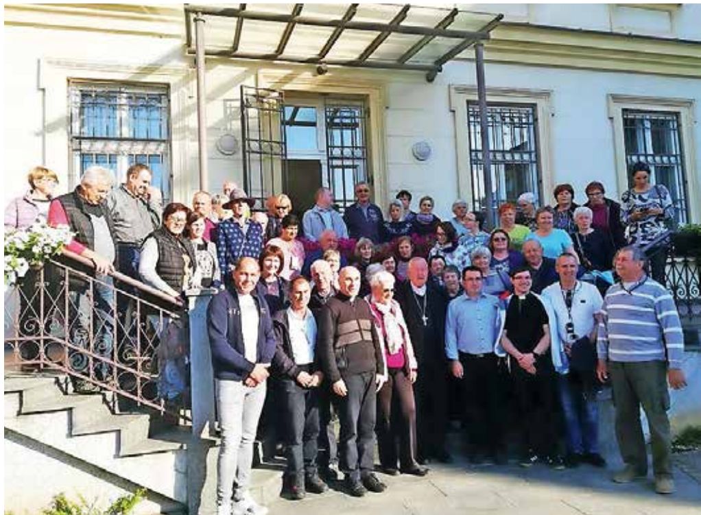
Udeleženci romanja v Srbijo in Severno Makedonijo

Molimo rožni venec. Kljub temu da je veliko sveta po Šumadiji neobdelanega, je Srbija druga v Evropi po pridelovanju malin, prva je Rusija. Prispemo v Niš. Ogledamo si kapelico z vzdanimi glavami srbskih junakov, ki so jih premagali Turki 1809. leta. Nato ogled ostan-