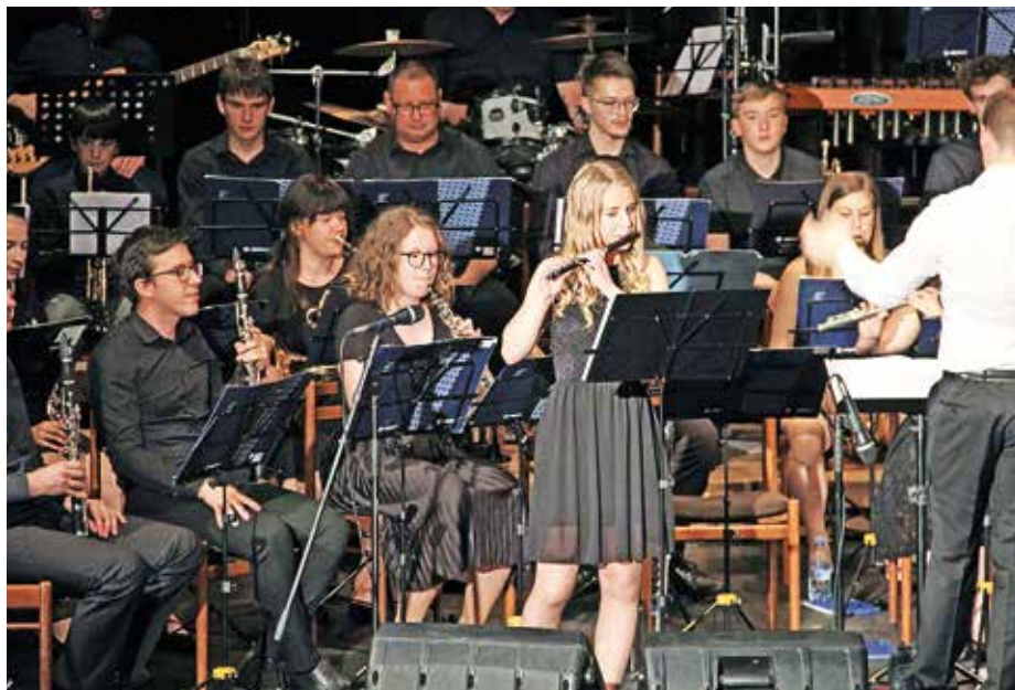
S koncerta Pihalnega orkestra Alpina Žiri v Žireh

ček, ki nam je v skladbi Fičfirič istega skladatelja zaigrala na pikolo in gledalcem predstavila nezaupljivega mladega fanta. Tudi njeno igranje je vzbudilo zaupanje v mlade glasbenike, saj pikolo