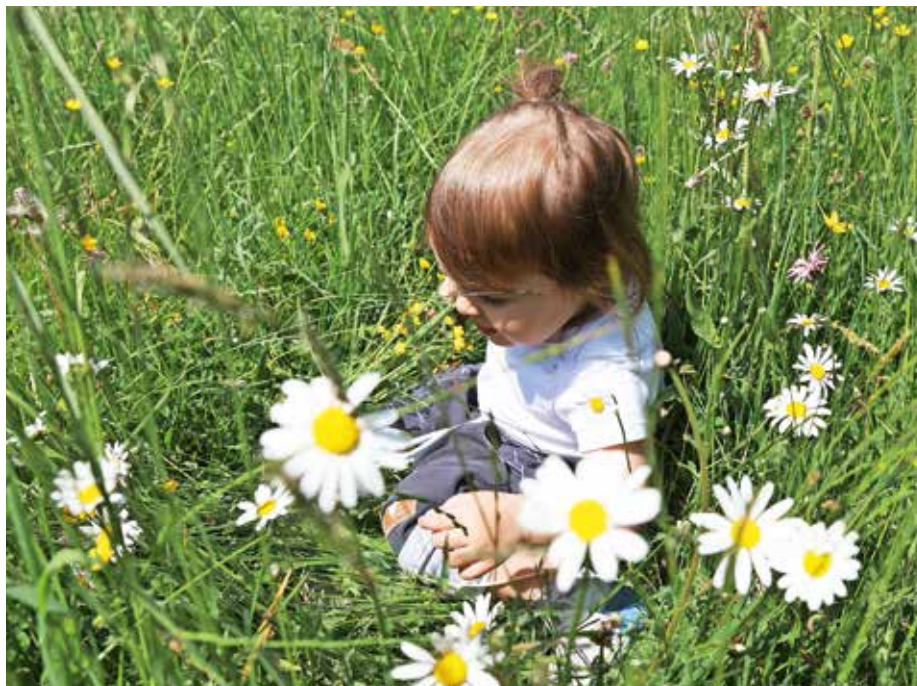
Pri aktivnostih v naravi se je treba zaščititi pred klopi.