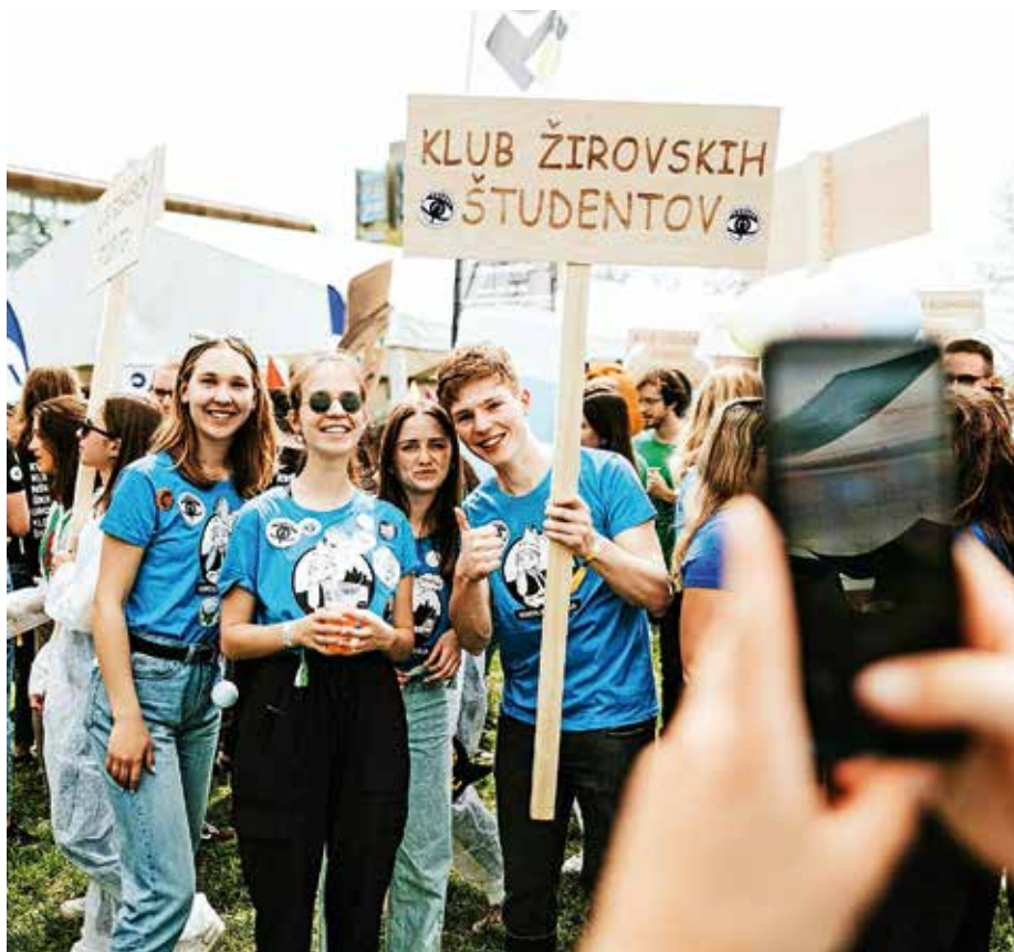
Klub žirovskih študentov na Škisovi tržnici

Sicer se je prireditve poleg našega kluba udeležilo še 54 študentskih klubov iz celotne Slovenije. Klubi smo bili po regijah razporejeni v šest tako imenovanih otočkov. Na gorenjskem otočku so obiskovalci našli tudi našo stojnico. Tam so pokušali Burnikovo ocvirkovo potico in pa pijačo brucomor, ki jo sicer pripravimo brucem na vsakoletnem brucovanju KŽŠ. V popoldanskem delu so potekale klubske igre, na katerih je zmagala naša, torej gorenjska regija. Zvečer pa so ob dveh odrih obiskovalci uživali ob glasbi različnih glasbenih izvajalcev. Med drugim so nastopili Zmelkoow, Vlado Kreslin in Mali bogovi, Mi2 ter Siddharta. Dogodka se je udeležilo več kot 28 tisoč obiskovalcev.