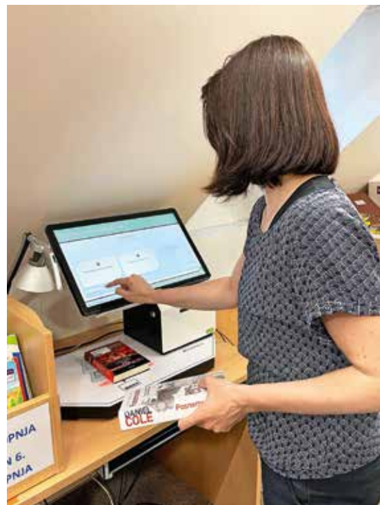
V knjižnici v Žireh je po novem na voljo »knjigomat«.

Za več informacij o uporabi naše nove tehnologije vam predlagam obisk knjižnice še pred poletjem. Poletni dnevi bodo tako mirni in brezskrbni, saj bo na vaši knjižni polici vedno nova in sveža literatura.