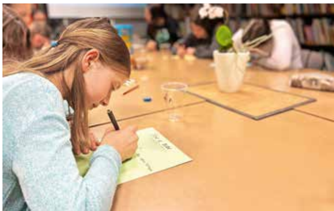
Učenci so pisali tudi svoja sporočila, v katerih so druge spodbudili k branju. / Foto: arhiv šole