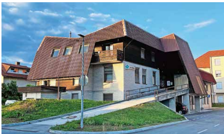
Zdravstvena postaja v Žireh je potrebna prenove.

Projekt je na seji podrobneje predstavil Primož Erznožnik iz Projektivnega inženiringa atelje 9. Poudaril je, da je energetska sanacija nujna, saj je bila stavba zdravstvene postaje zgrajena leta 1981