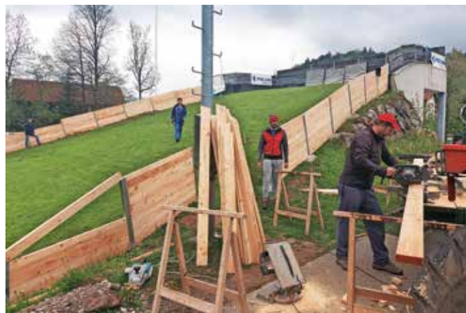
Pri postavitvi dodatne varnostne ograje so pomagali prostovoljci.