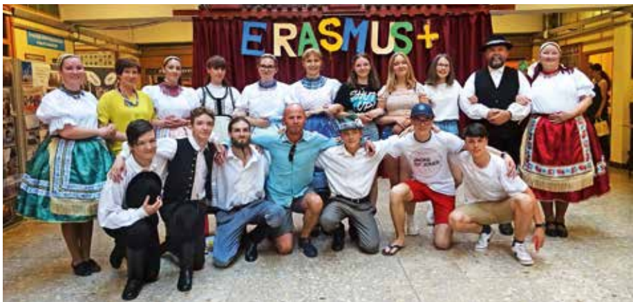
V sklopu projekta Z igro proti nasilju so gostovali na Madžarskem.