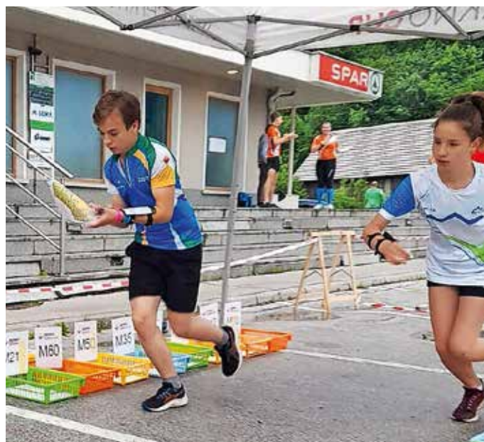
V Žireh je potekala šesta tekma Slovenske sprint orientacijske lige v letošnji sezoni.

Od 12. do 15. avgusta OK Azimut organizira tradicionalno mednarodno tekmovanje Cerkno Cup, ki bo posamezne etape gostilo v Cerknem, Črnem Vrhu nad Idrijo in Logatcu.