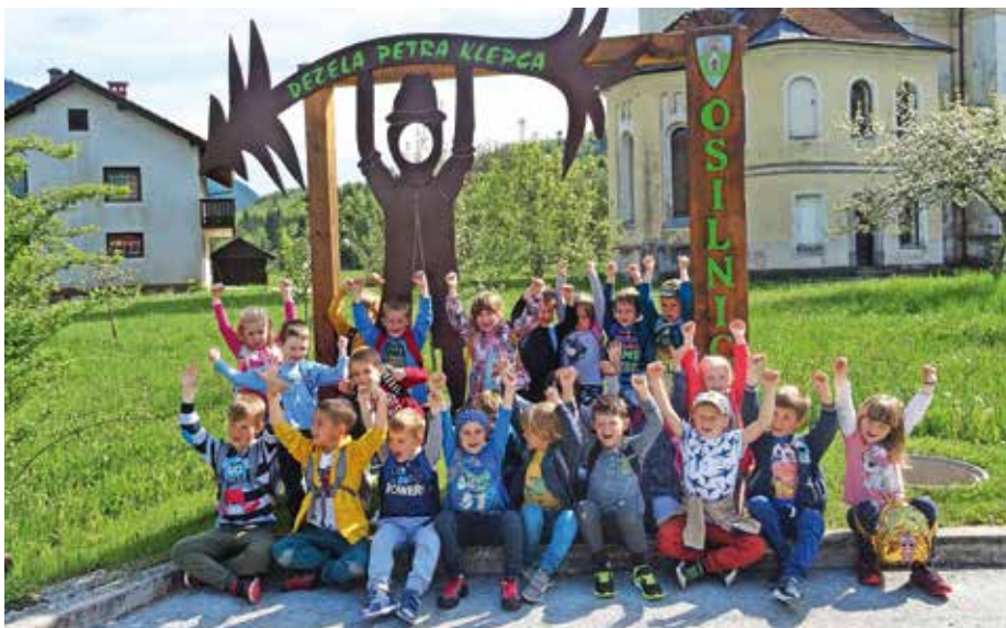
Pred vstopom v šolo so obiskali Osilnico – deželo Petra Klepca.