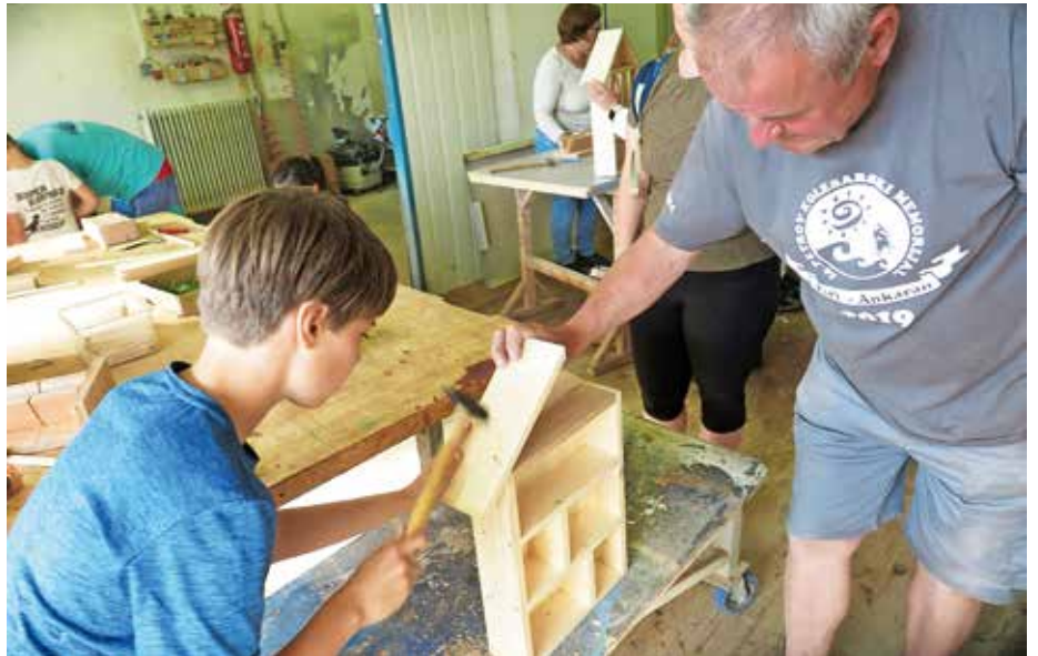
Na delavnici LU Škofja Loka so izdelovali hotele za žuželke.