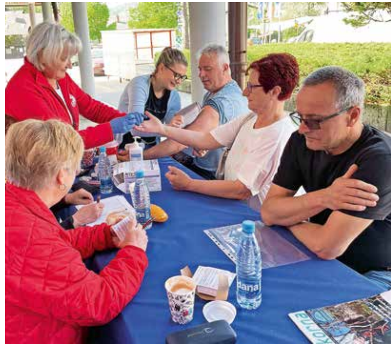
Meritve krvnega sladkorja sredi maja

Žirovci se dobro odzivajo tudi na razne meritve, ki so preventivnega značaja in spodbuda za varovanje zdravja in zdravega načina življenja. V Tednu Rdečega križa smo spet lahko organizirali meritve krvnega sladkorja in tlaka, v sodelovanju z Društvom bolnikov z osteoporozo Kranj pa UZ merjenja kostne gostote na petnici, ki se ga je udeležilo 47 oseb. Bernarda Lukančič je naredila tudi kratko statistiko meritev krvnega sladkorja: »Meritve se je udeležilo 15 oseb, starih med 30 in 40 let, 24 oseb, starih med 60 in 70 let (dve osebi z visoko vsebnostjo krvnega sladkorja), 51 oseb, starih od 70 do 80 let, 38 oseb, starih od 80 do 90 let (ena oseba z visoko vsebnostjo