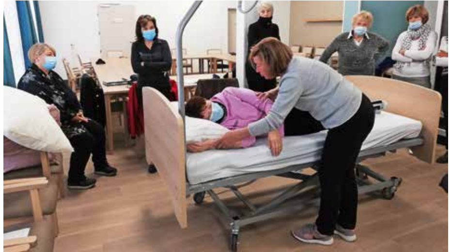
Fizioterapevtka je tečajnike naučila, kako pomembno je gibanje tudi za osebe, ki ne morejo več veliko hoditi ali pa sploh ne hodijo.

Odzivi tečajnikov so bili večinoma pozitivni, o čemer priča tudi prisotnost udeležencev, ki je bila skozi celoten potek tečaja zelo velika. Na tečaju smo pridobili veliko znanja, ki lahko olajša oskrbo v domačem okolju. Poleg tega smo se na tečaju družili in izmenjali izkušnje, ena izmed udeleženk je zapisala: »Po drugi strani pa si vsi želimo pridobiti še več praktičnega znanja, saj so prikazi, ki smo jih naredili v sklopu tečaja, premalo in bi si vsak sam želel izvesti vse